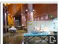
クラフトコーナー