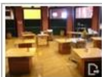
ワークショップ ホール